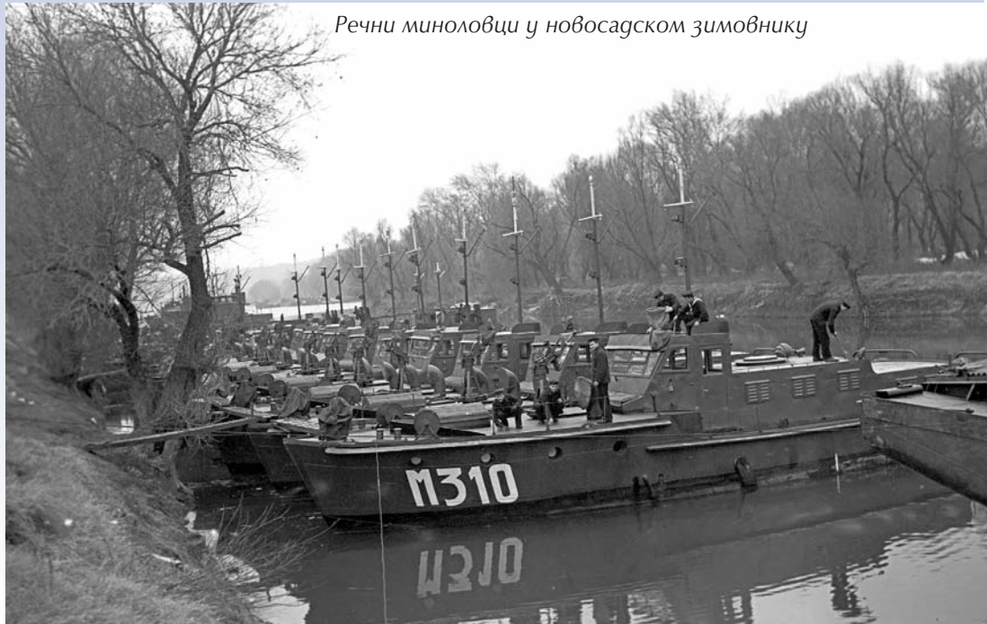
Речни миноловци у новосадском зимовнику

Основни задаци Речне ратне флотиле огледали су се у обезбеђењу властитог речног саобраћаја, извођењу противминске одбране и запречавању река, превозењу јединица и опреме, диверзантских и противдиверзантских дејстава и подршци јединицама копнене војске које борбена дејства изводе на води и захвату водних путева. Поред ових задатака јединица је у миру извршавала задатке обезбеђења државне границе на граничним рекама и обуку структура ван