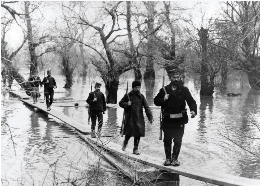
Борци Велике и Мале Аде Циганлије