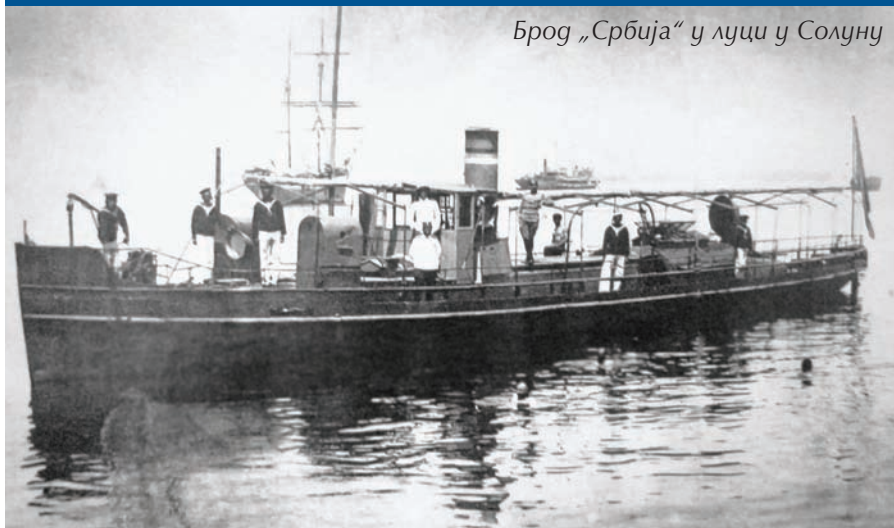
Брод „Србија“ у луци у Солуну

„Србија“ је имала депласман од 50 тона, а бројала је сталну посаду од 12 чланова, састављену од капетана и лађара са Саве и Дунава. Брод је поносно пловио под српском тробојком на пловним рутама дуж Крфа, а највећи испит положио је испловивши за српском војском за Солун 12. маја 1916. са 19 чланова посаде. Након шест дана пловидбе кроз навигацијски тешко подручје Коринтског канала и савладавши опасности које су претиле у Егејском мору, „Србија“ је упловила у солунски луку, а Бродарска команда постала је позната и призната у савезничким поморским круговима.