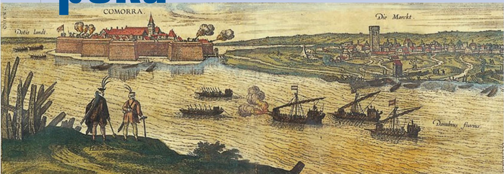
Шајке у боју у ојсади дунавског ушврђења Коморан у XVII веку

В ековима су се Подунављем кретали народи и војске, мешале се културе и развијале цивилизације, док се Дунав налазио у средишту циљева освајачких народа. Важно раскршће стратегијских комуникација, европска жила куцавица и драгоцен водена саобраћајница, Дунав је од давнина био предмет и освајања и заштите, што је условило и појаву војних речних снага. На обалама Дунава, упоредо с трговачким, настајале су и развијале се речне ратне флотиле, које су одлучиле многе битке на рекама, а Подунавље се често претварало у крваво бојиште.