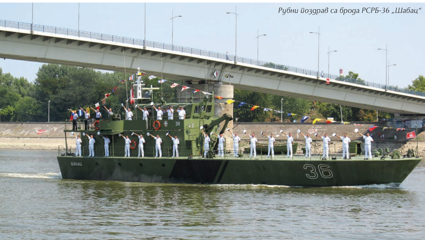
Рубни поздрав са брода РСРБ-36 „Шабац“