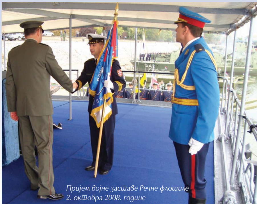
Пријем војне заставе Речне флотиле 2. октобра 2008. године

случају природних непогода показали су се драгоценим током ангажовања у одбрани од поплава изазваних изливањем река из својих корита у мају 2014. године. На задацима спасавања и евакуације угроженог становништва спасени су многи животи угрожених у поплавленим градовима и насељима. Припадници Речне флотиле нашли су се на свим критичним местима широм Мачванског, Колубарског и Моравичког округа у одбрани од водене стихије, док је искуство из Бродарева допринело брзом постављању и одржавању