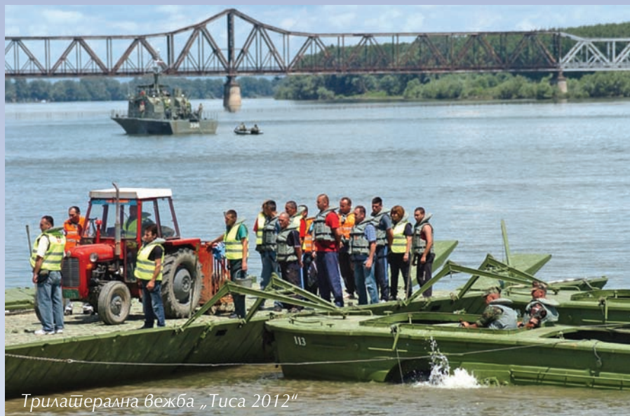
Трилатерална вежба „Тиса 2012“

нав одају се почасті страдалим херојима са „Драве“.