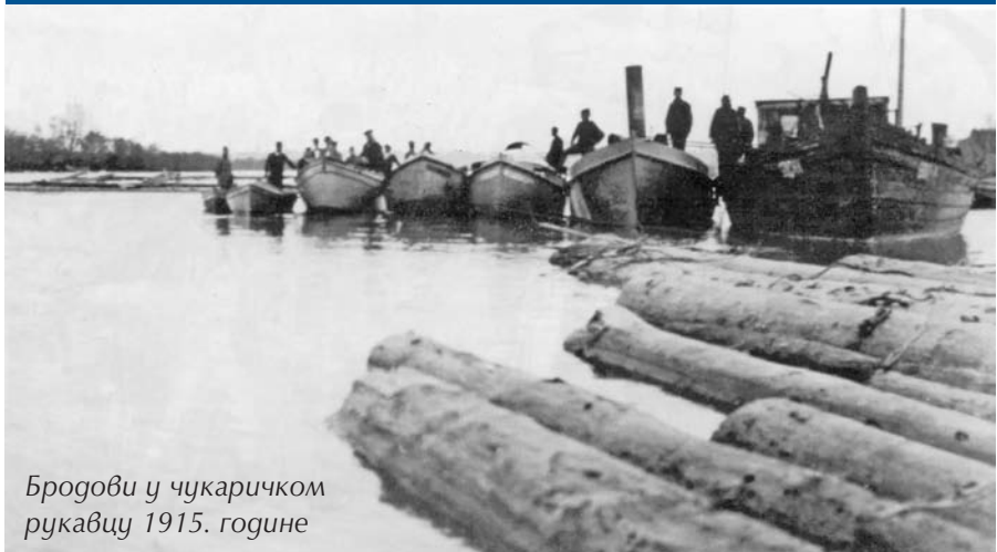
Бродови у чукаричком рукавцу 1915. године

По објави рата Турској 1876. године Кнежевина Србија употребила је против снажне турске речне флотиле на Дунаву речне мине. Била је то прва употреба минског оружја у ратовима у Европи, а захваљујући изведеним минским дејствима војска је била ослобођена обавезе да непрекидно обезбеђује дугачки и осетљиви речни гранични сектор уз смањење могућности отварања новог и тешко брањивог фронта. Полагање мина на Дунаву уродило је плодом и постигнут је велики успех ангажовањем незнатних средстава, до тада мало познатог оружја.