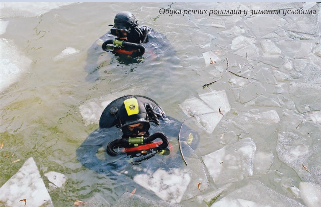
Обука речних ронилаца у зимским условима

Агресију НАТО-а 1999. године Речна ратна флотила дочекала је спремна, а у непосредним припремама изведена је правовремена дисперзија средстава ратне технике и покретних