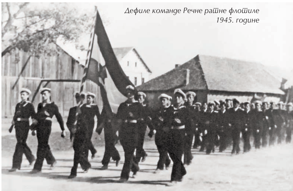
Дефиле команде Речне рајне флотиле 1945. године

По извршеним променама 1957. године, Команда Речне ратне флотиле враћена је, са својим организацијским јединицама и установама, поново у своје старо седиште у Нови Сад. Јединицу су тада чинили: речни монитор „Сава”, речна јахта „Крајина”, Одред речних оклопних чамаца, Одред речних патролних чамаца, Одред речних миноловаца, Одред речних помоћних бродова, Одред десантних бродова, Одред речних распремљених бродова, Језерски гранични одред, 362. складиште ратних резерви, 225. морнаричко-техничко складиште, Лучка