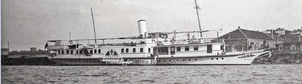
Његовог Величанства брод „Драгор“

Сремској Каменици. Основни проблеми огледали су се у томе што нису постојале снаге за заштиту положених минских препрека, а каснило се и у модернизацији и опремању савременијим артиљеријским бродским наоружањем, првенствено за борбу против нисколетећих ваздухоплова. Бродови су били наоружани оруђима претежно из периода Првог светског рата, застарелим и недовољним да одговоре на прави начин изазовима надоласећег оружаног сукоба који ће заувек променити свет.