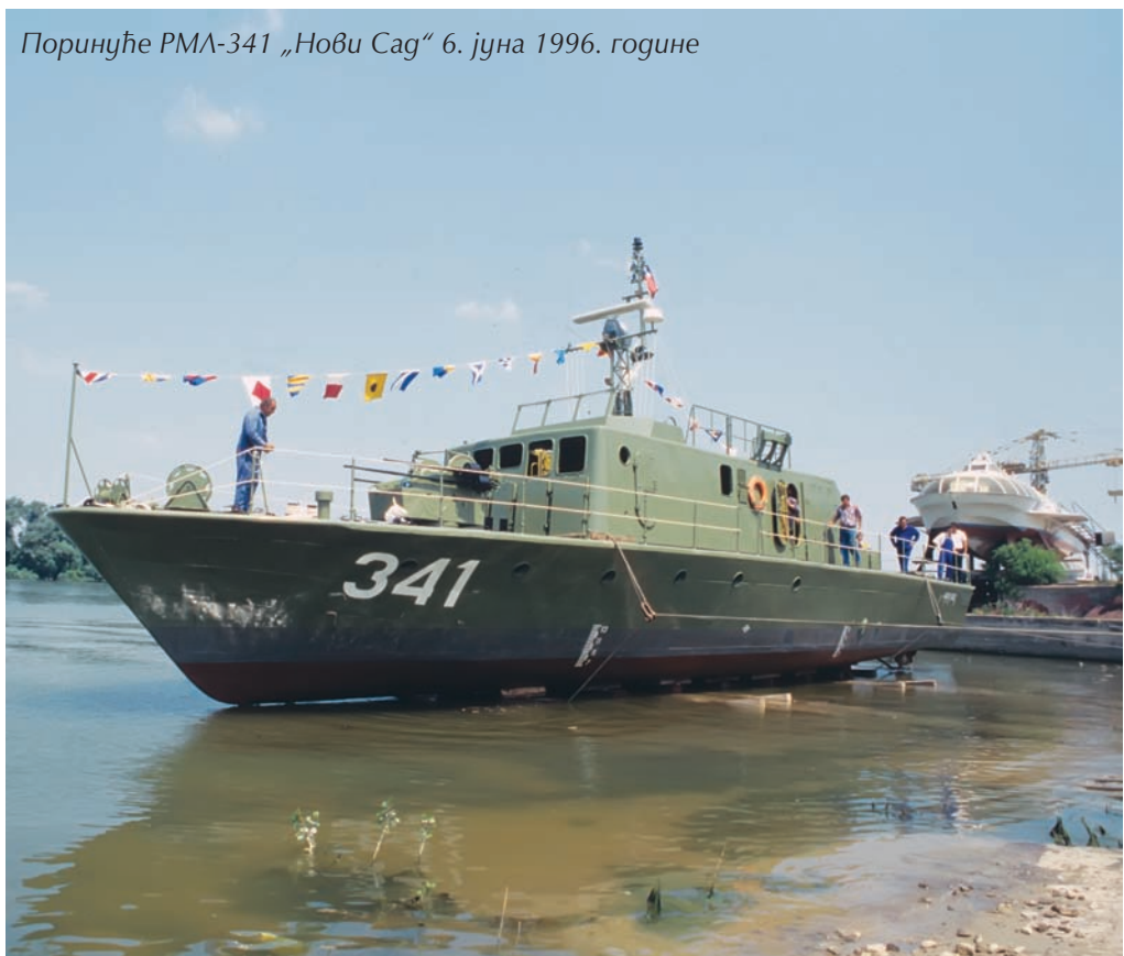
Поринуће РМЛ-341 „Нови Саг“ 6. јуна 1996. године

Диверзантска дејства представљала су важан облик борбених дејстава Речне ратне флотиле. Добро планирана, организована и усмерена, уз висок степен изненађења, најчешће