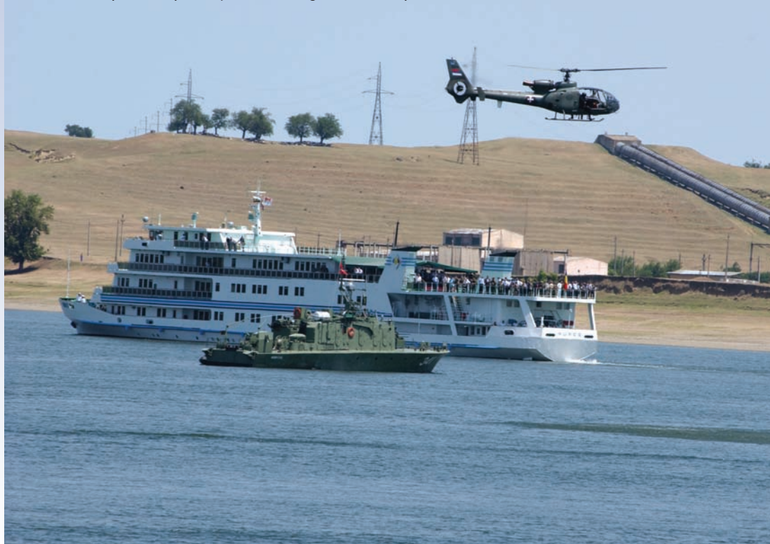
Учешће на шрилајтералној вежби „Дунавска смотра 2007“

нирским батаљоном, стационарним у Шапцу и Новом Саду.