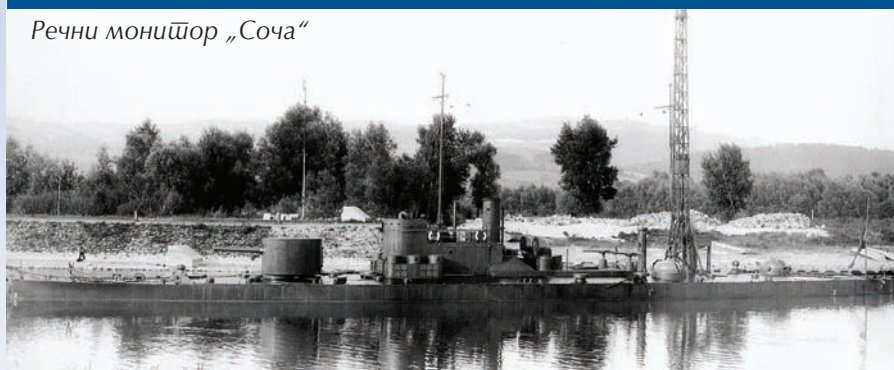
Речни монитор „Соча“

Преглед и основни подаци о речним мониторима 1. јануар 1923. године