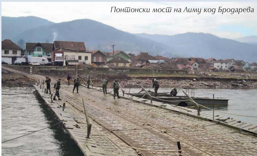
Понтонски мост на Лиму код Бродарева

У Шапцу, на реци Сави, од 12. до 14. јуна 2012, организована је међународне вежбе помоћи цивилним властима у случају поплава – „Тиса 2012“.